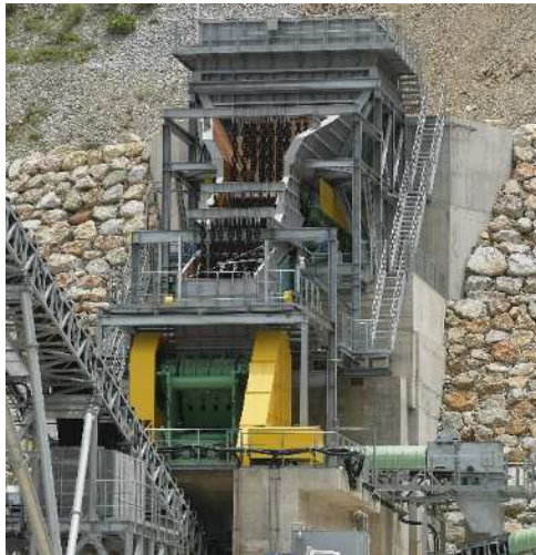
一次破碎周辺設備

古河産機システムズのマテリアル機械は、足尾銅山の選鉱技術をルーツとし、100年以上の経験と実績を有しています。砕石・鉱山で使用される破碎機、粉碎機、スクリーンをフルラインナップで提供するとともに、周辺プロセスを含めたセクションプラントの設計・据付工事まで一貫して行うエンジニアリング体制の強化を進めています。古河産機システムズは、今後も、お客さまの多様なニーズに応えるため、機械製作からプラント施工まで、一貫したサービスを提供してまいります。