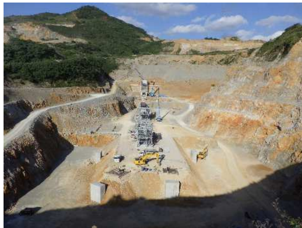
基礎+架台工事 (2024年12月)