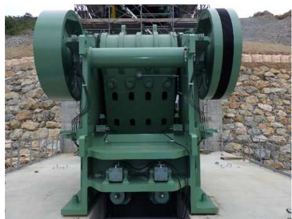
シングルツグルクラッシャ（一次破碎）