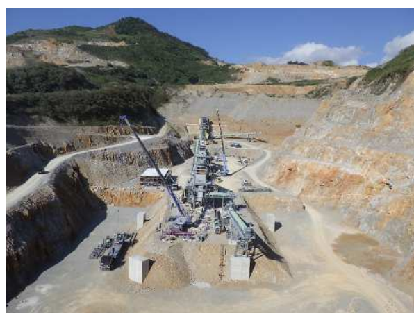
機械据付工事 (2025年3月)