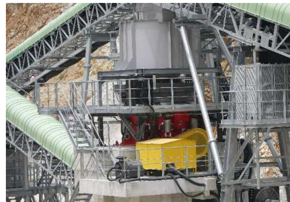
コーンクラッシャ（二次破碎）