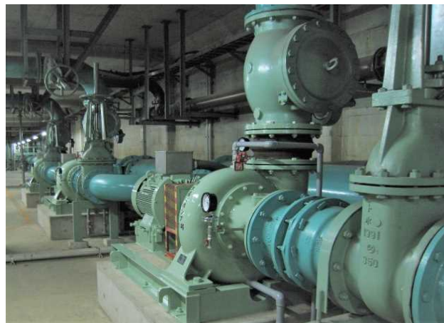
ポンプ設備イメージ